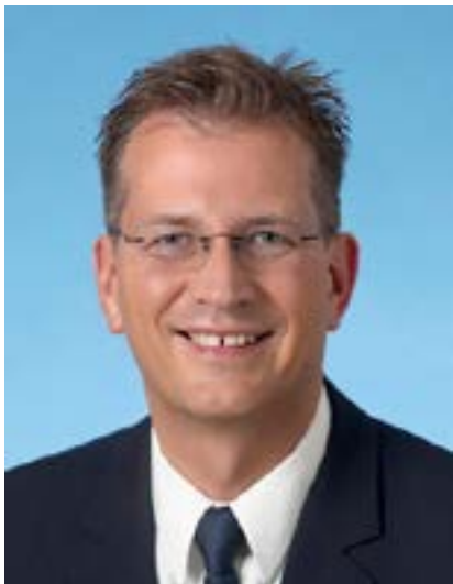
Dr. Ralf Brauksiepe Parlamentarischer Staatssekretär bei der Bundesministerin der Verteidigung

In den Krisengebieten im Nahen und Mittleren Osten sowie in Afrika haben sich die Lebensbedingungen in den vergangenen Jahren zum Teil deutlich verschlechtert. Instabile politische Verhältnisse gepaart mit prekären humanitären Verhältnissen sorgen dafür, dass vielen dort lebenden Menschen die eigene Lage hoffnungslos erscheint. Die Folge davon sehen wir heute in Deutschland und Europa: Eine in den zurückliegenden Jahrzehnten nicht dagewesene Welle von Flüchtlingen hat uns erreicht und stellt die europäische Solidargemeinschaft als Ganzes und die Einzelstaaten jetzt und in Zukunft vor große Herausforderungen.