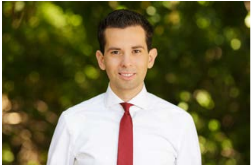
Dr. Martin Pätzold Ausschuss Arbeit und Soziales Ausschuss für Angelegenheiten der Europäischen Union der CDU/CSU-Bundestagsfraktion

Die Mittel für die Förderperiode 2014 - 2020 sind bereits verteilt und bewilligt worden, wobei die Strukturfondsmittel für Deutschland gegenüber der vorangegangenen Förderperiode gesunken sind. Allein der Bund erhält gegenüber der vorangegangenen Förderperiode rund 23 Prozent weniger Mittel aus dem Europäischen Sozialfonds (ESF), bezogen auf die Strukturfonds insgesamt beläuft sich dieses Minus auf rund 32 Prozent. Gefördert werden mit den Geldern z.B. das Programm zur Stärkung der berufsbezogenen Sprachkompetenz von Migranten oder das Sonderprogramm zur ar-