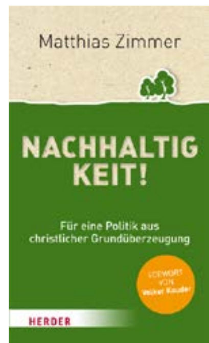
„Nachhaltigkeit - Für eine Politik aus christlicher Grundüberzeugung“ ist erschienen im Herder-Verlag mit der ISBN-Nummer 978-3451305085

In seinem Vorwort unternahm der Vorsitzende der CDU/CSU-Bundestagsfraktion, Volker Kauder, einen interessanten Rückblick auf die Vorläufer der Nachhaltigkeitsdebatte in der Unionsgeschichte. So sei für Ludwig Erhard schon der Wohlstand Ausgangspunkt, aber kein Leitbild der Lebensgestaltung gewesen.