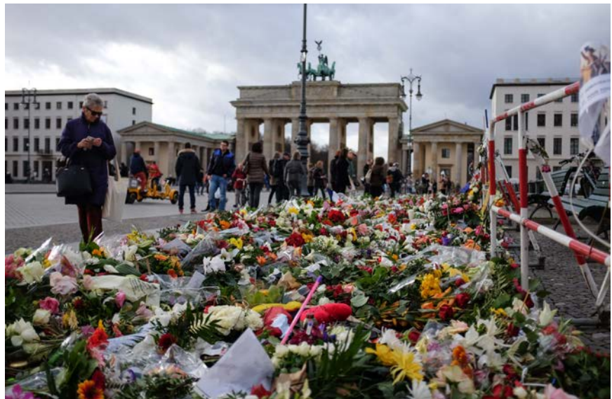
Trauerbekundungen nach den Terroranschlägen von Paris

Zudem seien die Erkenntnisse über Terroristen national oft vorhanden, jedoch könnten andere europäische Staaten nicht darauf zugreifen, kritisierte der Unions-Innenpolitiker Clemens Binninger: „Wenn Attentäter in