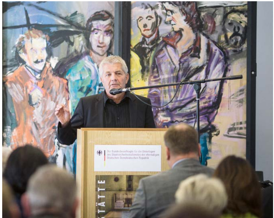
Roland Jahn bei der Eröffnung einer Stasi-Ausstellung in Dresden

Gleichwohl sprechen sich die Koalitionsfraktionen für einen Transformationsprozess aus. Die Behörde solle gemeinsam mit dem Bundesarchiv ein Konzept für die Zusammenfüh-