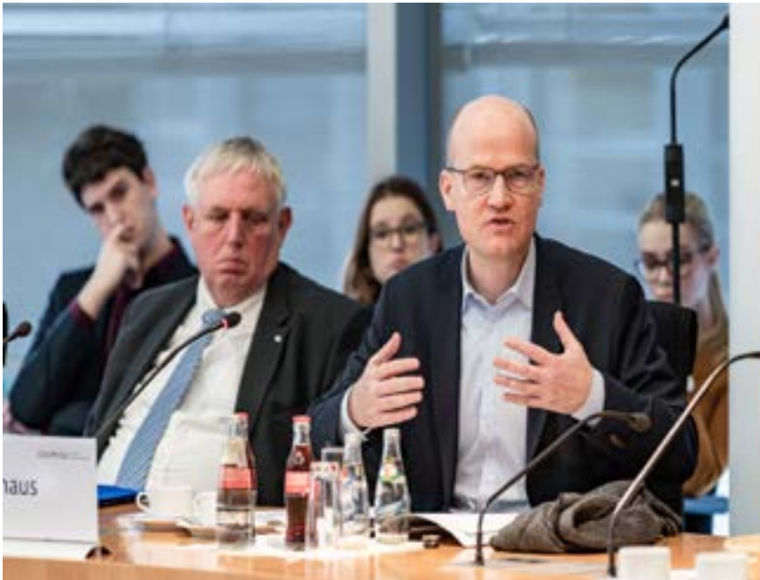
Diskutieren mit über das Impulspapier zur Weiterbildung: Fraktionschef Ralph Brinkhaus und NRW-Arbeitsminister Karl-Josef Laumann (links)