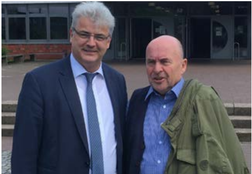
Rainer Eppelmann , Vorsitzender der Bundestiftung zur Aufarbeitung der SED-Diktatur, mit Axel Knoerig von der Arbeitnehmergruppe ( links )

Mit Erfolg hat sich die Arbeitnehmergruppe für eine Aufstockung der Mittel für die Bundestiftung zur Aufarbeitung der SED-Diktatur im Bundeshaushalt 2020 um 1,4 Millionen Euro auf 6 Millionen Euro eingesetzt.