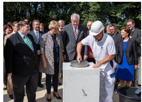
Einbringung der Zeitkapsel in Anwesenheit von Ministerpräsident Horst Seehofer und der Beauftragten der Bundesregierung für Kultur und Medien, Staatsministerin Monika Grütters

der Sudetendeutschen füllen einen wichtigen Platz in den Beziehungen zur Tschechischen Republik aus. In dieser Hinsicht sei das Museum eine wichtige Ergänzung. Der Sprecher der Sudetendeutschen Volksgruppe, der langjährige Europaabgeordnete Bernd Posselt, dankte dem Freistaat Bayern und dem Bund, der sich mit bis zu 10 Millionen Euro an des Kosten des Museumsneubaus beteiligt, für die massive Unterstützung in Sachen Museum und hob vor allem hervor, es gehe "nicht nur um Vitrinen und Erinnerungsgegenstände, sondern um ein