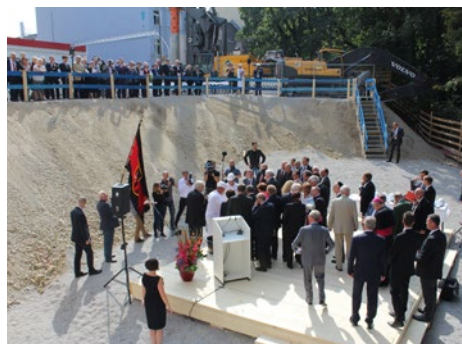
Während der Grundsteinlegung an der Hochstraße in München zwischen Gasteig und Isar

lebendiges Zentrum für eine trotz Vertreibung sehr lebendige Volksgruppe, die derzeit gerade den Übergang in die nachwachsenden Generationen" schaffe. Zusammen mit dem angrenzenden "Sudetendeutschen Haus" und dem "Haus des Deutschen Ostens" soll das Museum zum neuen Zentrum für die Kulturpflege der deutschen Heimatvertriebenen werden. Eine wichtige Lücke in der Erinnerungslandschaft für diesen einstmalig deutsch geprägten Teil Mittelest- und Südosteuropas wird auf diese Weise geschlossen.