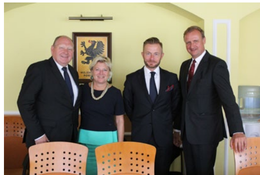
Mit dem Vize-Marschall der Wojewodschaft Pommern, Ryszard Swilski (2.v.r.), und Generalkonsulin Cornelia Pieper in Danzig.

wurde auch beim Besuch von Schlobitten deutlich, wo die eindrucksvolle Ruine des Schlosses der Fürsten und Burggrafen zu Dohna bis heute die Landschaft prägt. Nach einer Besichtigung der heute katholischen Dorfkirche Schlobittens kam es zu einem Ge-