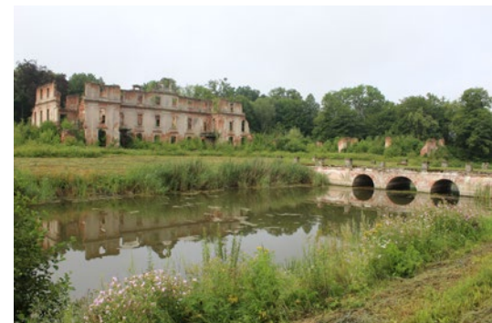
Auch über 70 Jahre nach seiner Zerstörung prägt die Ruine von Schloss Schlobitten die Landschaft Ostpreußens